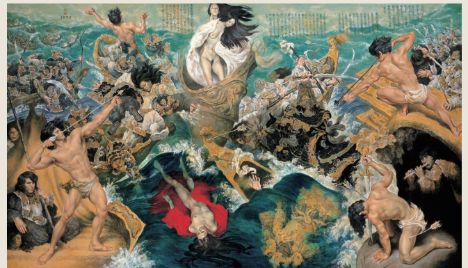
牧野邦夫作「海と戦さ」（1975 年 / 194cm×97cm）

東京都（現在の渋谷区幡ヶ谷）で生まれたが、幼少期の一時を小田原で育つ。戦時中再び小田原に疎開し、美校（現東京藝術大学）に通い、昭和 23（1948）年同油画科卒業。当初グループ展に作品を発表した以外は、団体展等に所属せず個展を中心に創作活動を展開。昭和 61（1986）年、癌により急逝。その精緻かつイメージに富む作品群は平成 25（2013）年練馬区立美術館での回顧展で大きな反響を呼んだ。