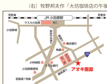
（右）牧野邦夫作「大坊珈琲店の午後」