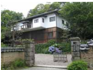
松永記念館(牧野氏像展示中)

http://www.city.odawara.kanagawa.jp/kanko/event/DEC/hibusematuri.html