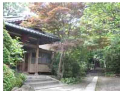
秋葉山量覚院(玄関に大天狗あり)

詳細情報は、『続・西部劇通信』( http://www.connec.co.jp/makinos/ )で掲載予定です。