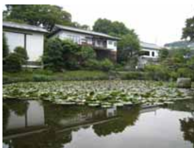
松永記念館 庭園より臨む