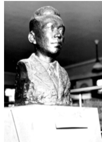
牧雅雄作 牧野氏像 (松永記念館で展示中)